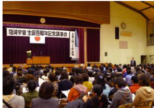
主催者代表挨拶 村松 繁氏